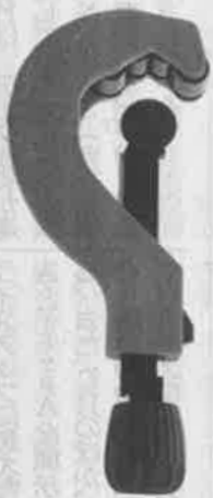
ドレンマルチくん

同製品の大きなポイントには日本向けに独自開発したカッターホイール。素材や熱処理、角度等を再検討し、40Aの肉厚も