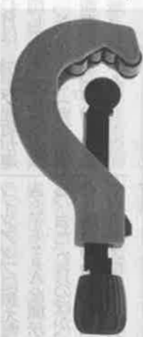
ドレンマルチくん

なお今回の製品は「N e k i a」ブランドの第一弾製品であり、今後同ブランドから製品を発売していく構え。